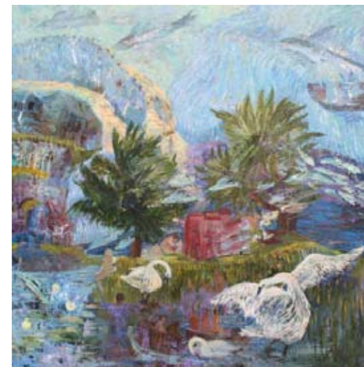
"Susen". Maleri af Grethe Tranberg.

Denne maler, som bor i København, maler fortrinsvis bibelske eller mytologiske motiver med særdeles farverige personer og lokaliteter.