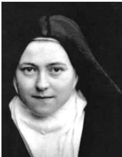
Thérèse af Lisieux

1997 ophøjet til kirkelærer. Hendes "lille vej" (dagbog) fik dermed den højeste officielle anerkendelse. Med en uforlignelig friskhed og inderlighed forstod hun, at