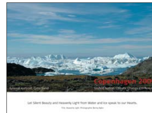
Plakat til klimakonferencen.

Ved samme fernisering uddeles den sidste præmie – en lille skål af keramikeren Helle Fabricius – som præmie for et nyindmeldt medlem i kunstforeningen.