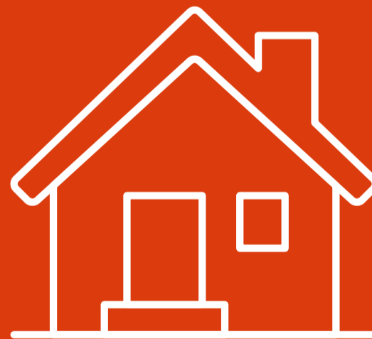
Hãy ở nhà nếu bạn bị đau ốm

Tìm giải đáp các thắc mắc của bạn tại helsenorge.no