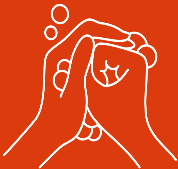
Rửa tay thường xuyên và kỹ